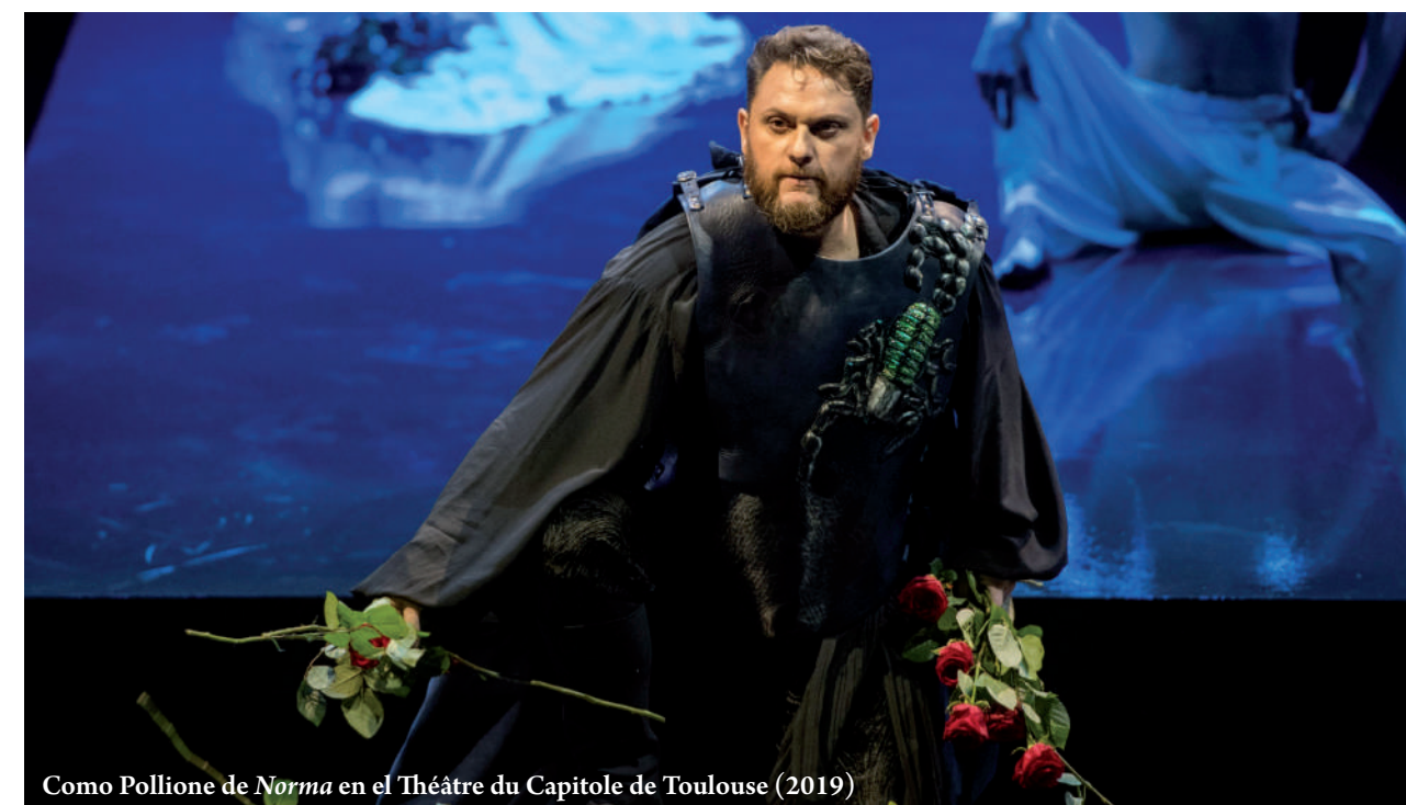
Como Pollione de Norma en el Théâtre du Capitole de Toulouse (2019)

en el ensemble de solistas. Ha interpretado los roles de Pollione ( Norma ), Alfredo ( La Traviata ), Faust ( Faust ), Edgardo ( Lucia de Lammermoor ), Fenton ( Falstaff ), Don Ottavio ( Don Giovanni ), Ulysse ( Pénélope ), Apolo/Dionysos ( Orest ), Tamino ( Die Zauberflöte ) o Tebaldo ( I Capuleti e i Montecchi ), entre otros. Protagoniza los estrenos mundiales de la recientemente recuperada ópera Sardanápalo de Franz Liszt, editada por Audite, de Caruso a Cuba en Ámsterdam –por la cual obtiene el Schaunard Award a la mejor interpretación de 2019 en los Países Bajos–, así como el estreno absoluto de El