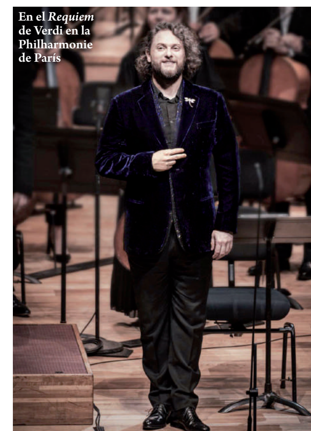
En el Requiem de Verdi en la Philharmonie de París