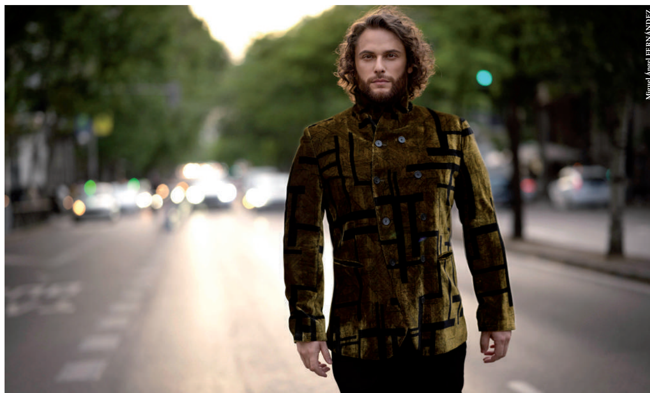
Miguel Ángel FERNÁNDEZ

• El tenor despide la temporada del coliseo barcelonés interpretando al protagonista de la ópera de Bellini. Próximos compromisos le llevarán a Lugano, Mainz, Budapest, Upsala, Pamplona, Madrid o Colonia, entre otras ciudades.